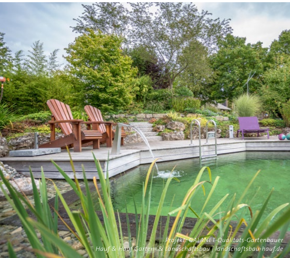
Projekt: GALANET-Qualitäts-Gartenbauer Hauf & Hauf Garten- & Landschaftsbau | landschaftsbau-hauf.de