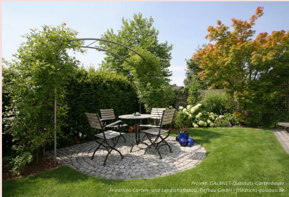
Projekt: GALANET-Qualitäts-Gartenbauer Friedrichs Garten- und Landschaftsbau, Tiefbau GmbH | friedrichs-galabau.de

Dieser Ort sei dem ehrenwerten Vergnügen gewidmet, das Auge zu erfreuen, die Nase zu erfrischen und den Geist zu erneuern. So hat der berühmte Gelehrte Erasmus von Rotterdam den Garten vor über einem halben Jahrtausend bezeichnet. Wie schon in den letzten beiden INGRÜN-Ausgaben zeigen wir Ihnen an dieser Stelle die schönsten Gärten, die von unseren GALANET-Qualitätsgartenbauern geplant und gebaut wurden. Von modern bis klassisch, von asiatisch bis mediterran – willkommen im GALANET Schaufenster.