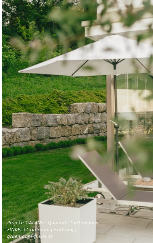
Projekt: GALANET-Qualitäts-Gartenbauer FINKELE | Grünraumgestaltung | gruenraum-finkel.de