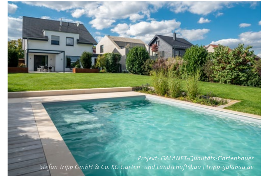
Projekt: GALANET-Qualitäts-Gartenbauer Stefan Tripp GmbH & Co. KG Garten- und Landschaftsbau | tripp-galabau.de

Mein persönlicher Glücksort entführt mich in eine eigene Welt. Eine Welt der Ruhe und Ausgeglichenheit. Der Alltag: vergessen. In meinem Rückzugsort, der mir Kraft schenkt und mich glücklich macht.