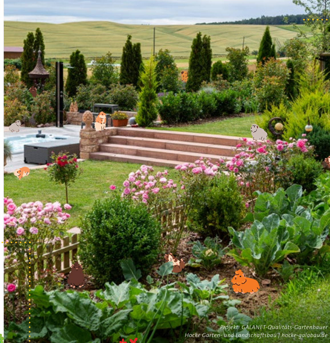
Projekt: GALANET-Qualitäts-Gartenbauer Hocke Garten- und Landschaftsbau | hocke-galabau.de